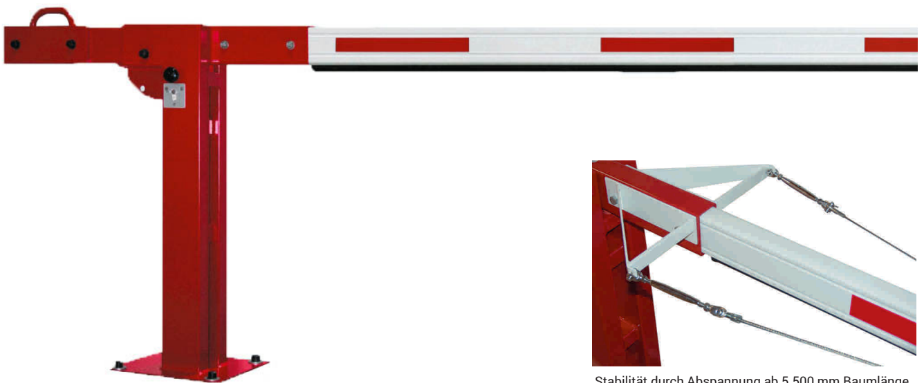
Stabilität durch Abspannung ab 5.500 mm Baumlänge