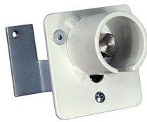
Feuerwehr-Dreikant am Schrankenständer