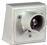
Feuerwehr-Dreikant am Auflagepfosten