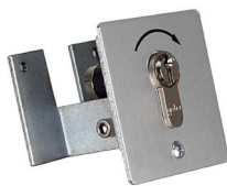
Profizylinderschloss am Schrankenständer