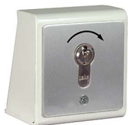
Profizylinderschloss am Auflagepfosten