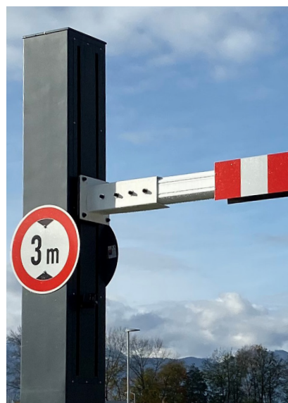
Sperrelement aus Aluprofil