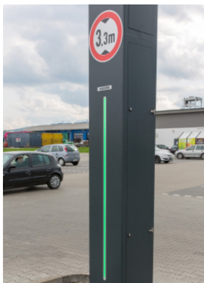
LED-Beleuchtung zur zusätzlichen Signalisierung