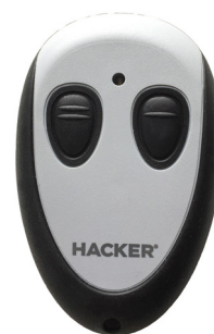
IS 43-2 IRP