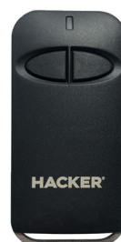
MS 43-2 IRP